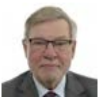
Björn von Sydow

Director Northern Europe Atlantic Council